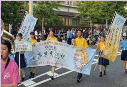
「清流の国ぎふ総文2024」パレードの様子

令和8年の夏、文化部のインターハイとも呼ばれる国内最大規模の高校生の芸術文化の祭典が、秋田県で45年ぶりに開催されます。全国各地から約2万人の高校生が集い、総合開会式とパレードからなる開会行事を皮切りに、19の規定部門と開催県独自に行う協賛部門で展示、発表、競技等が繰り広げられるほか、海外から3か国の団体（高校生）を招き、県内高校生と文化交流を行います。